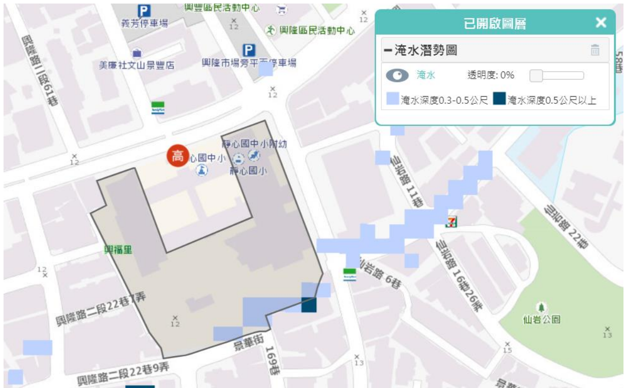
圖 2-6 淹水災害潛勢圖資