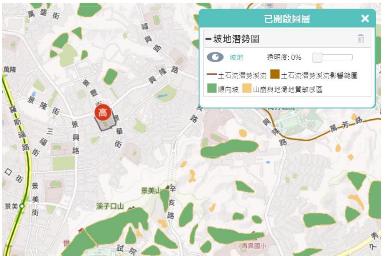
圖 2-7 坡地災害潛勢圖資