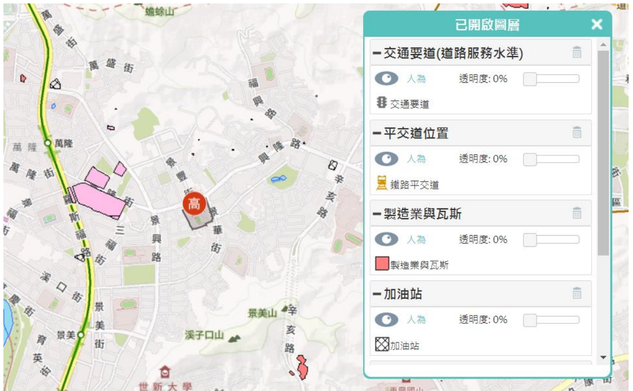
圖 2-8 人為災害潛勢圖資