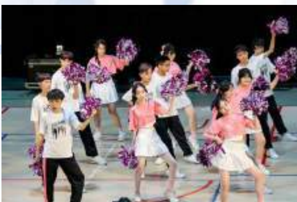
專注神情，完美演繹