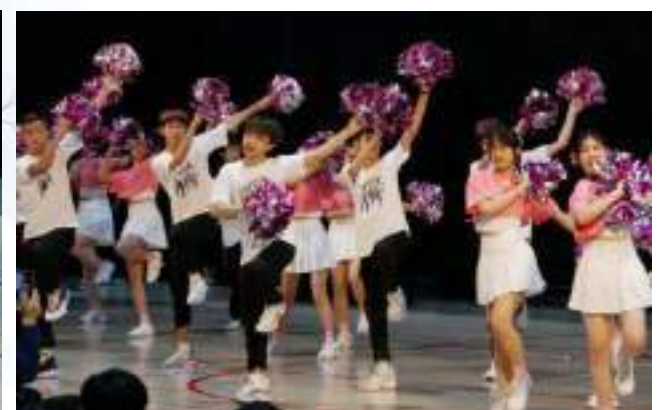
十熱精采表演吸引全場目光