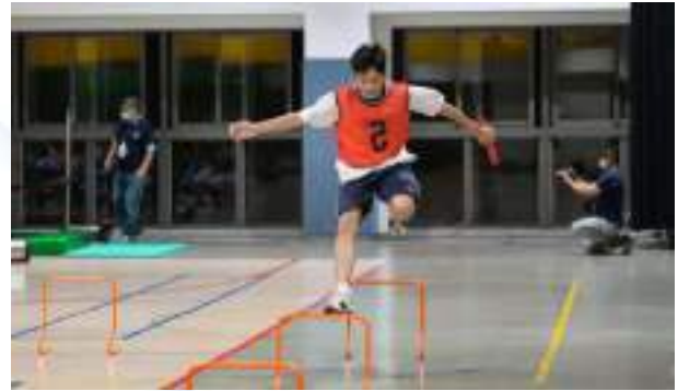
高中障礙賽-勇往直前之跨欄