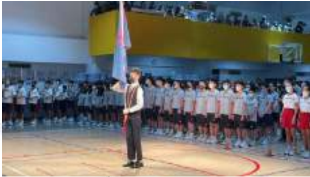
校慶運動會帥氣旗手

校慶運動會的趣味競賽、八段錦，以及高中個人的障礙賽，都是學生最有活力的項目，整個操場加油聲不間斷，全校嗨翻天。讓我們一起回顧精彩的花絮吧！