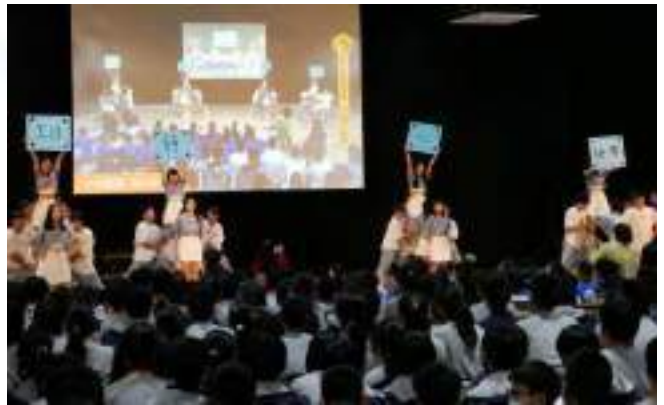
十誠勁歌熱舞，盡情展現青春活力