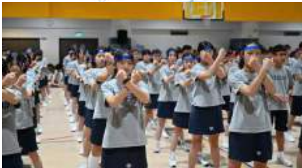
七年級八段錦比賽