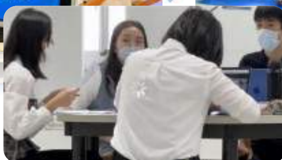
2022 Taiwan Schools Debate Challenge