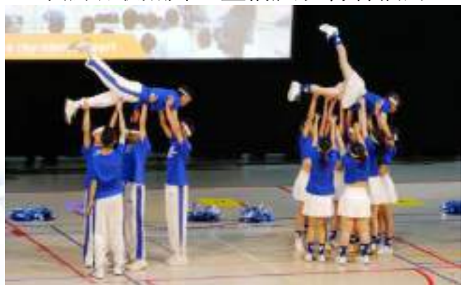
十愛結合啦啦隊技巧，呈現力與美