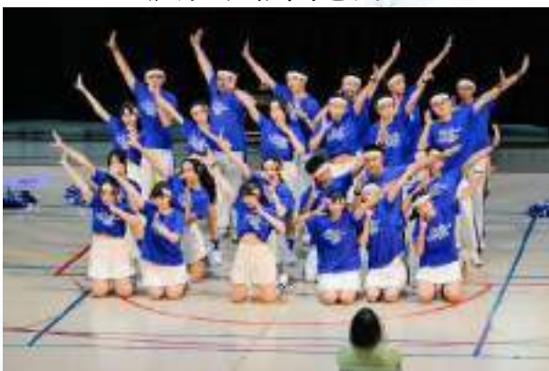
結合熱舞、啦啦隊與鏗鏘有力的口號